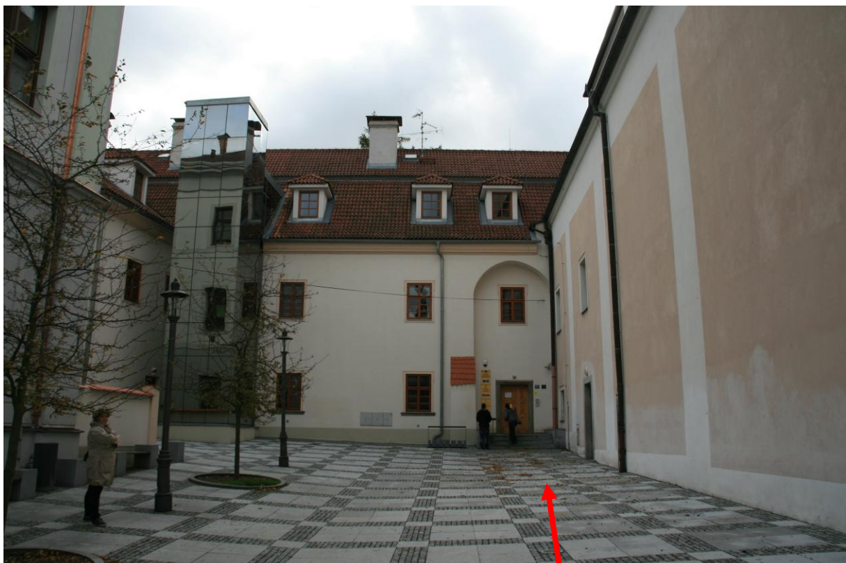
Hlavní vchod - školící prostory: Plánická č. 174.