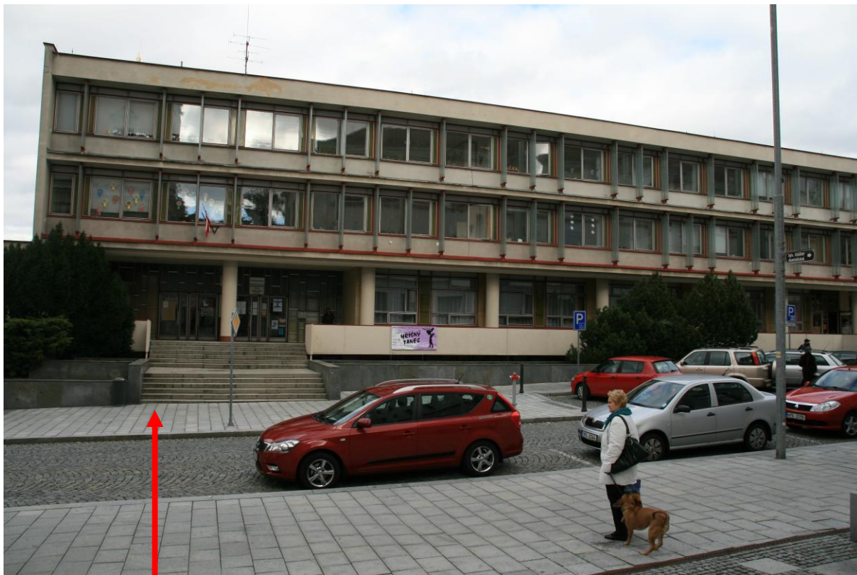
Protilehlá budova hlavního vchodu