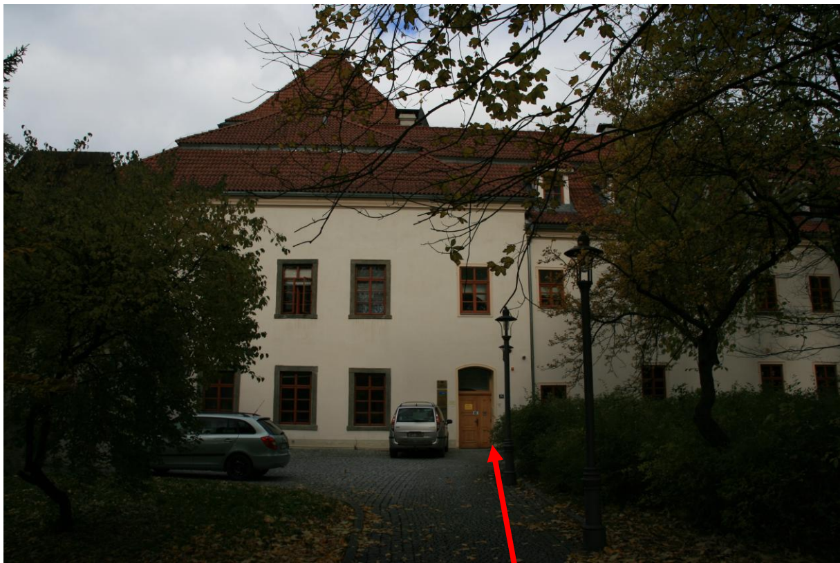
Zadní vchod - školící prostory