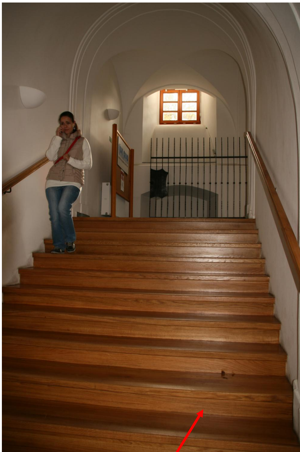
Učebna je v patře